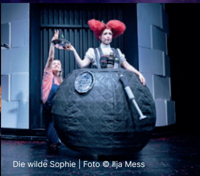
Die wildē Sophie